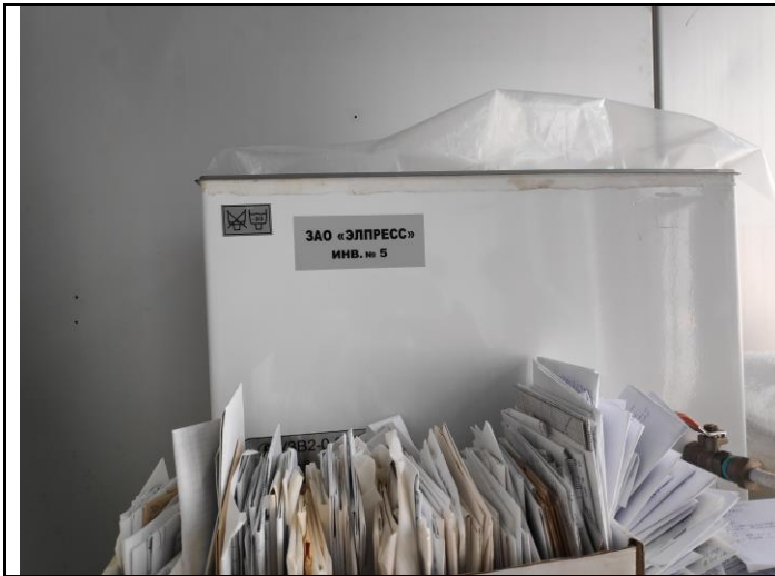
Ультразвуковая ванна типа УЗВ2-0,63/37