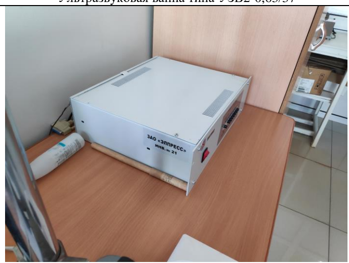
Система измерения удельного электрического сопротивления 4х.-зондовым методом и времени жизни н.н.з.