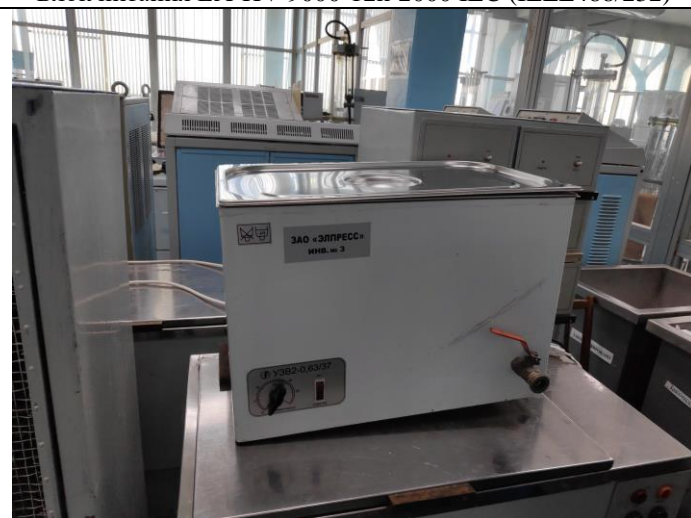
Ультразвуковая ванна типа УЗВ2-0,63/37