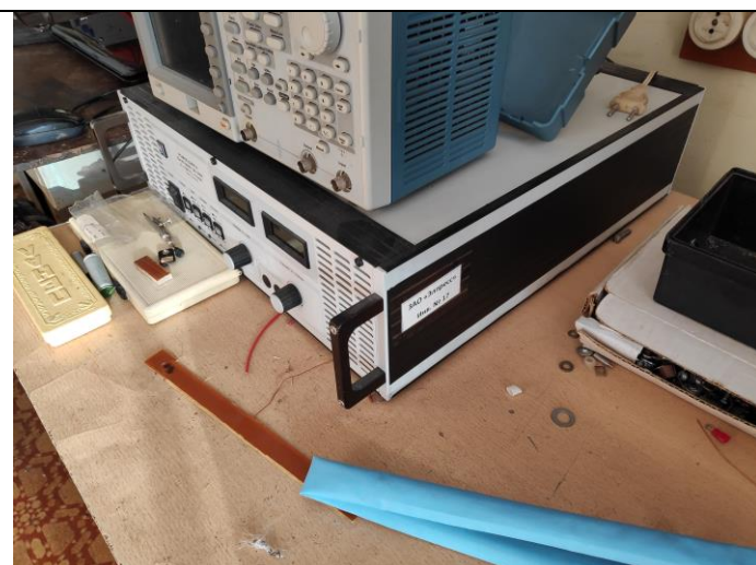
Блок питания EA-NV 9000-12k-2000 IEC (IEEE488/232)