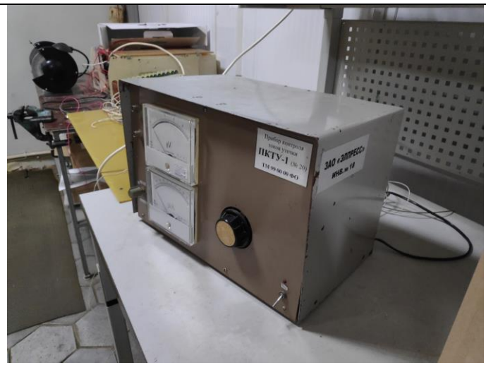
Прибор контроля стабильности токов утечки в собранных блоках