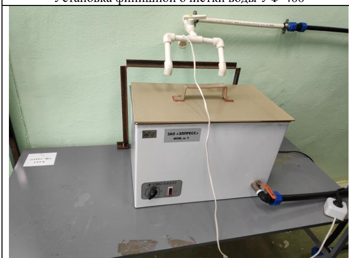
Ультразвуковая ванна типа УЗВ2-0,63/37