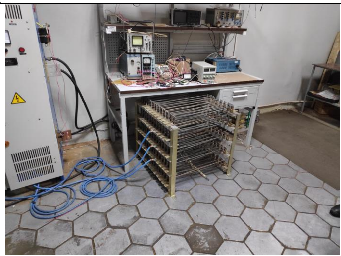
Испытательный стенд для проверки инверторов на основе IGBT-модулей в комплекте с нагрузкой