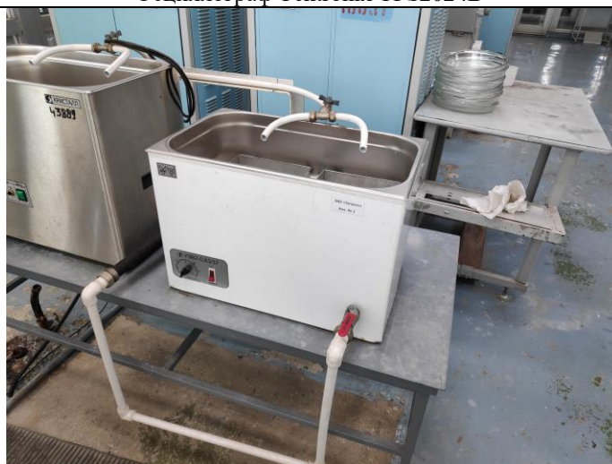
Ультразвуковая ванна типа УЗВ2-0,63/37