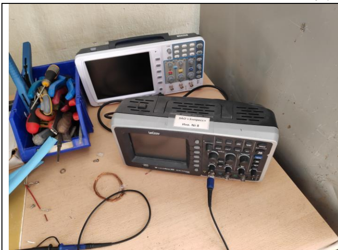
Осциллограф WaveAce 222

475 000 штук именных обыкновенных бездокументарных акций в составе пакета акций, состоящего из 475 100 штук именных обыкновенных бездокументарных акций, что составляет 99,98% уставного капитала АО «Элпресс» (ОГРН 1101327001423); указанный пакет принадлежит владельцам паев ООО УК "ПРОФИНВЕСТ" Д.У. Закрытым паевым инвестиционным фондом смешанных инвестиций «Региональный фонд инвестиций в субъекты малого и среднего предпринимательства Республики Мордовия» (регистрационный номер выпуска ценных бумаг 1-01-20498-Р от 16.12.2010г.)