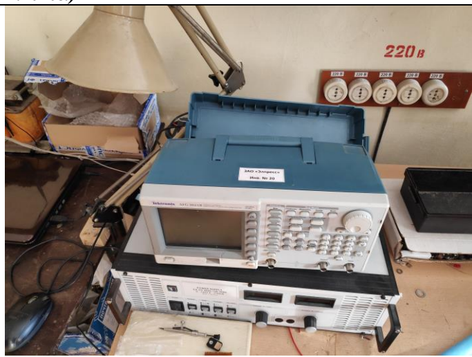
Генератор сигналов специальной формы AFG3021B Tektronix