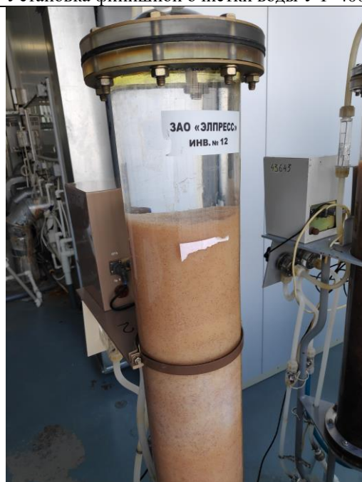
Установка финишной очистки воды УФ-400