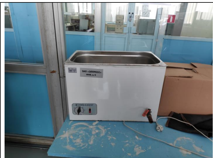
Ультразвуковая ванна типа УЗВ2-0,63/37