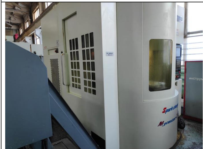
Вертикально-фрезерный обрабатывающий центр Kitamura с ЧПУ Kitamura-Fanuc 16iMB