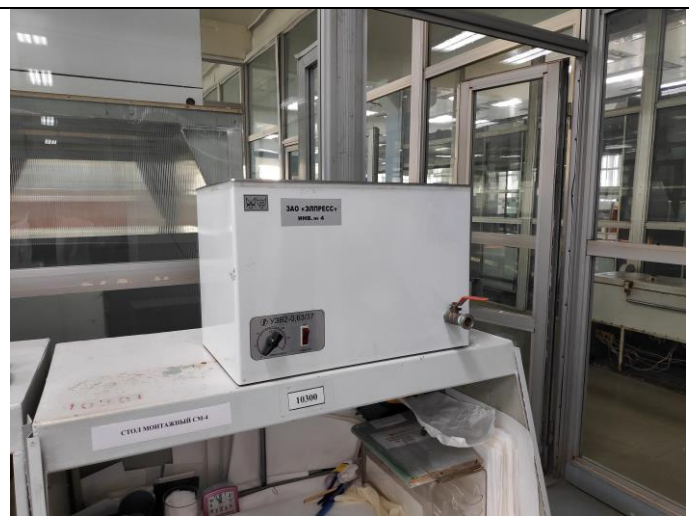
Ультразвуковая ванна типа УЗВ2-0,63/37