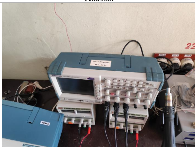
Осциллограф Tektronix TPS2024B