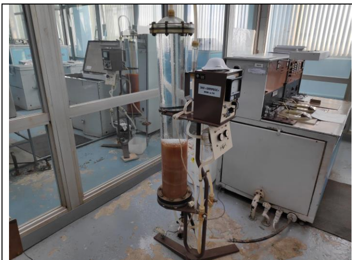
Установка финишной очистки воды УФ-400