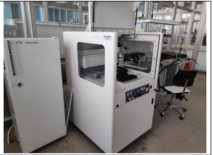
Высокоточный дозатор SPEKTRUM TM S-820