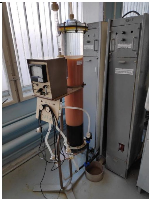
Установка финишной очистки воды УФ-400